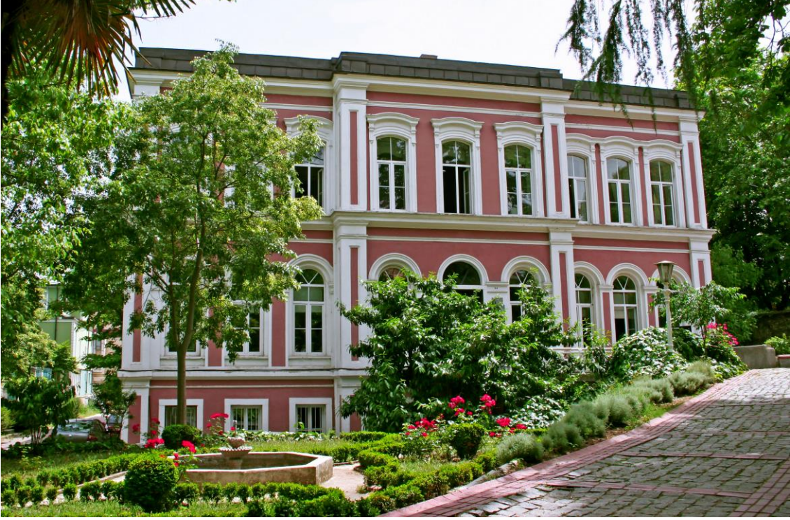
Beşiktaş Merkez Yerleşkesi Çukursaray Binası (F Blok)

yöneticilerin, bu sorumluluğun gereklerini harcama yetkilileri, mali hizmetler birimi ve iç denetçiler aracılığıyla yerine getireceği hüküm altına alınmıştır.