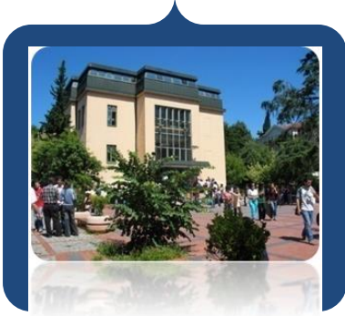
Yıldız Yerleşkesi Davutpaşa Yerleşkesi

Günümüzde üniversitemiz 11 Fakülte, 2 Enstitü, 2 Meslek Yüksekokulu, Yabancı Diller Yüksekokulu ve 36.000'i aşan öğrencisi ile eğitim-öğretimini sürdürmektedir.