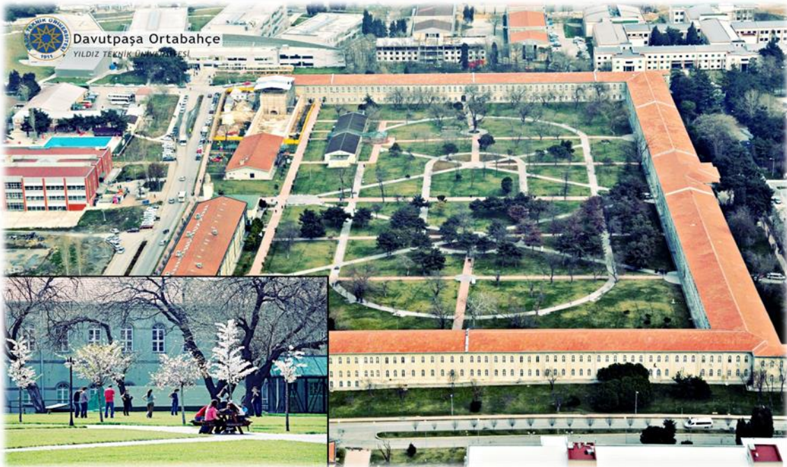
Davutpaşa Yerleşkesi Görünümü