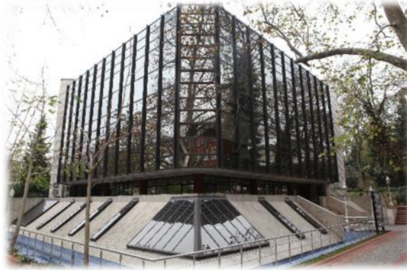
Yıldız Şevket Sabancı Kütüphanesi