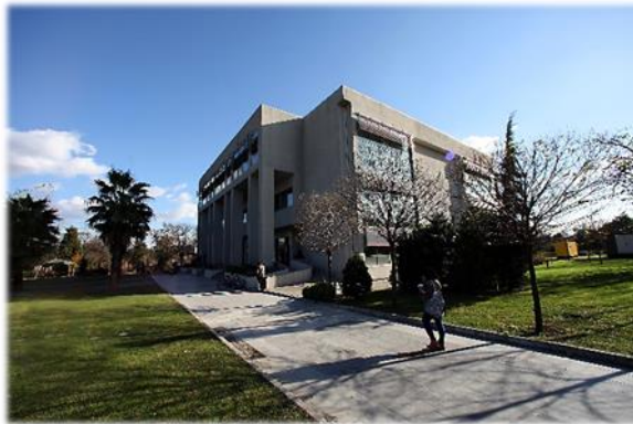
Davutpaşa Merkez Kütüphanesi