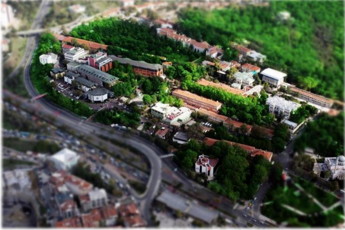
Yıldız Yerleşkesi Görünümü

Üniversitemiz Yıldız Merkez, Davutpaşa ve Maslak (Ayazağa) olmak üzere 3 yerleşkeye sahiptir.